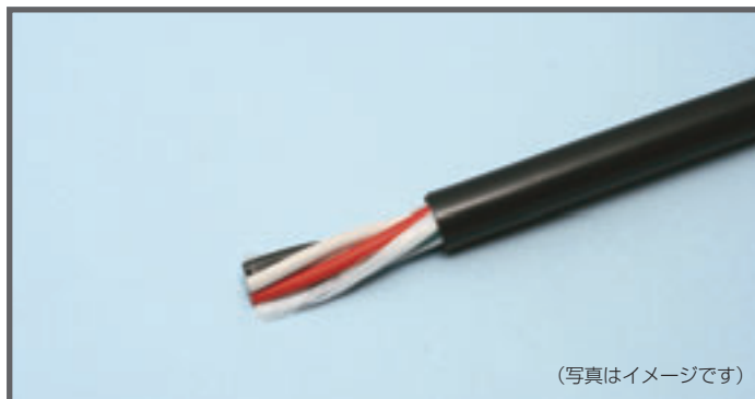
(写真はイメージです)